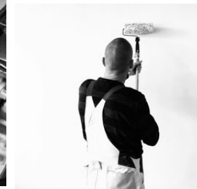
Stilleben im Mezzogiorno oder was bisher geschah ...